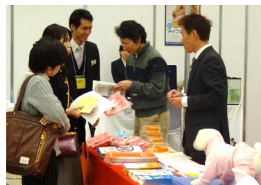
写真はイメージです!